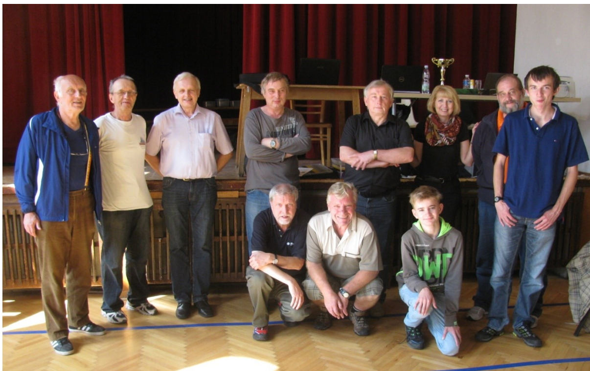
Turnaj Český Brod 2014.