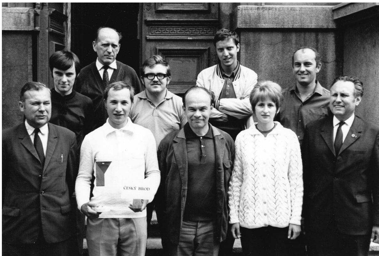
Turnaj čtyř měst 1972.