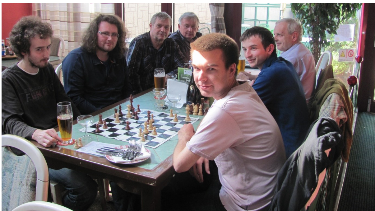
A družstvo, 2015.