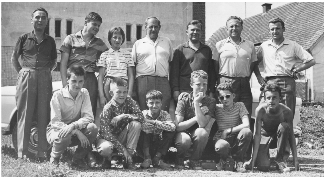
Vítězné družstvo Českého Brodu v Zaječicích 1964.