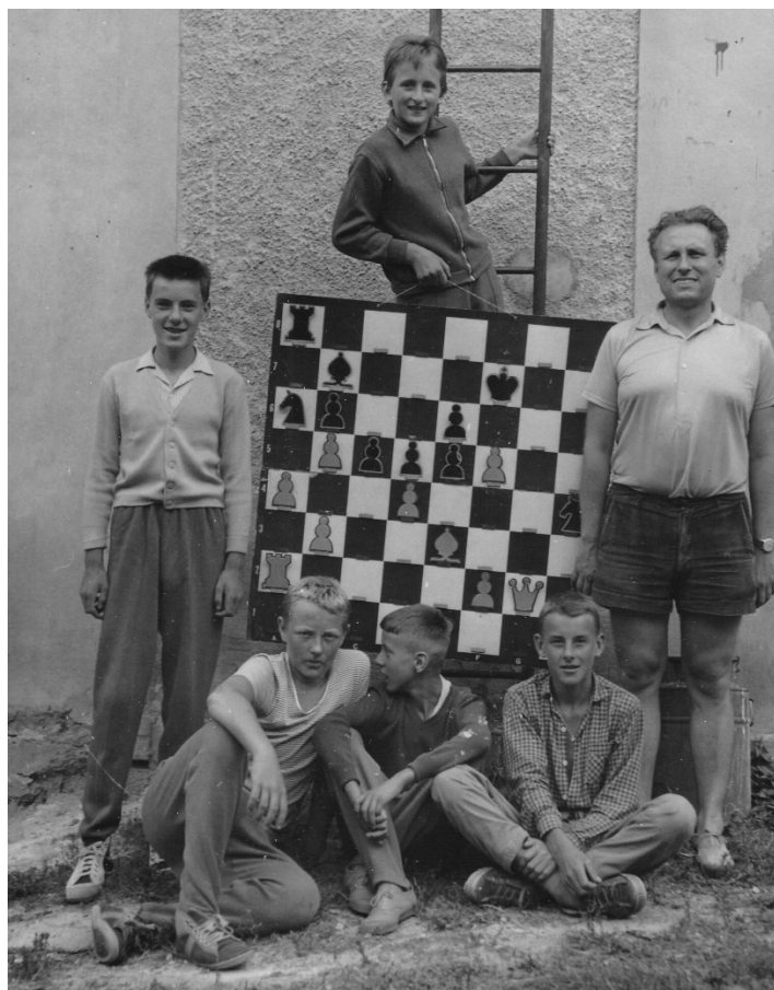
Krajský přebor žákovských družstev 1964.