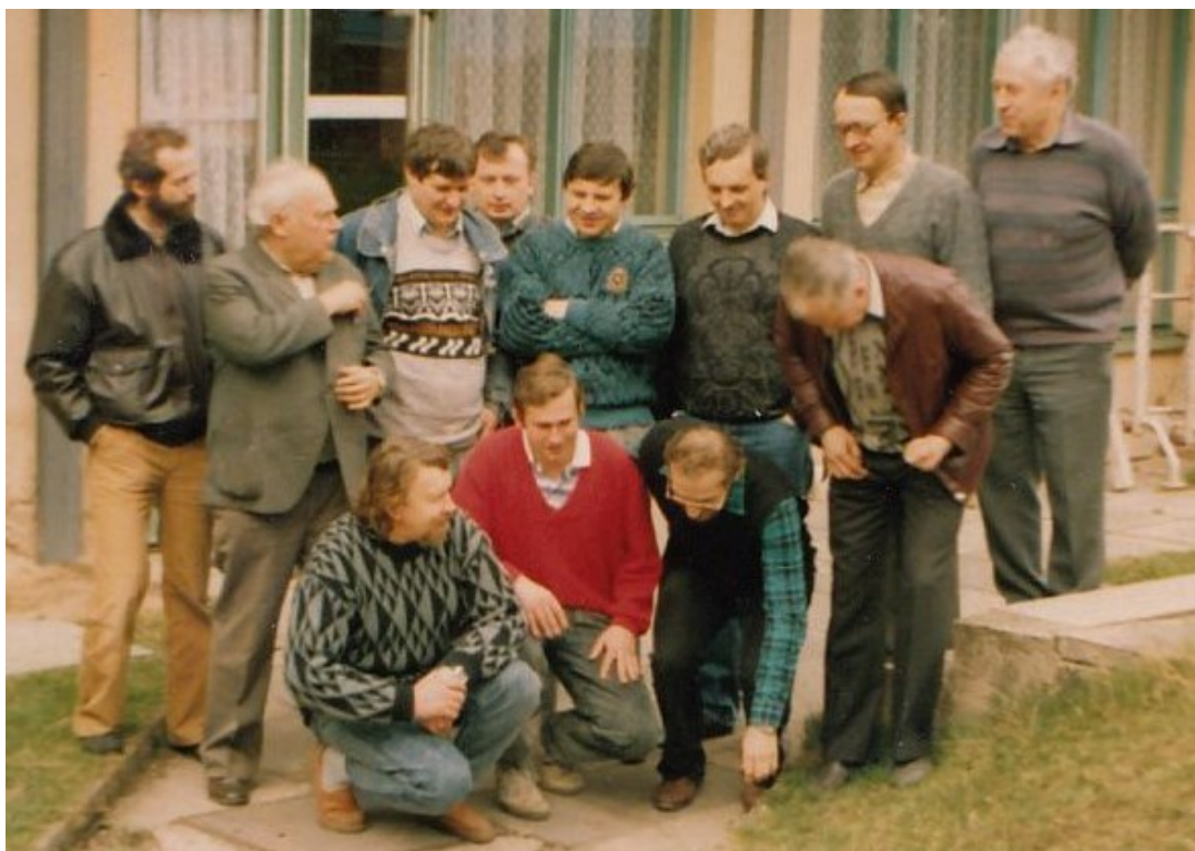
A družstvo, 1993.