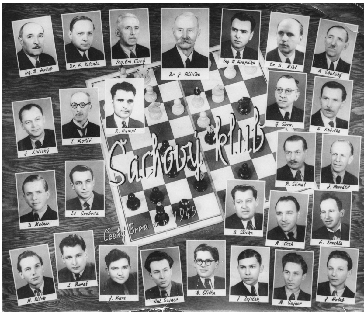
Tablo z roku 1945.